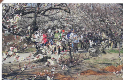
曾我梅林の梅祭り