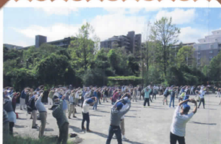
能見台 堀口北公園

健保連神奈川連合会HPに100キロウォークの写真を掲載していますので、是非ご覧ください。 https://kenpo-kanagawa.or.jp/general/walk/walk_archives/2019/2019-gallery