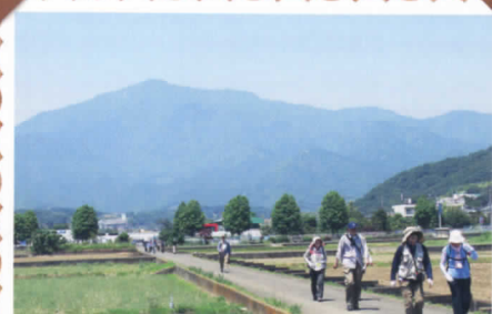
愛甲石田 田園地帯