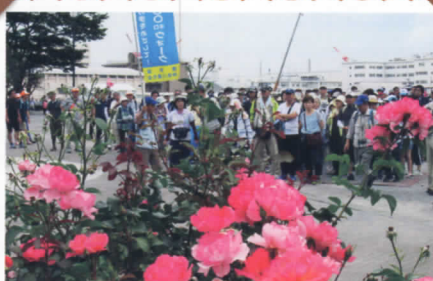
横須賀ヴェルニー公園